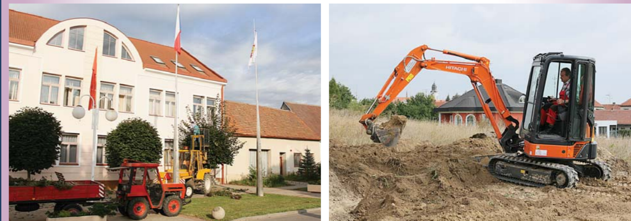
Také díky náročné práci Služeb města je u nás skutečně krásně!