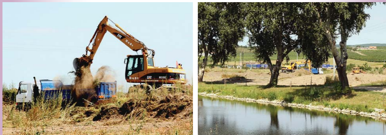
Čištění polních cest před vinobraním